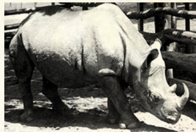
Rinoceronte vereador vira símbolo da luta contra a corrupção e da insatisfação dos cidadãos.